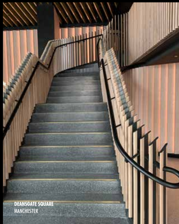
DEANSGATE SQUARE MANCHESTER